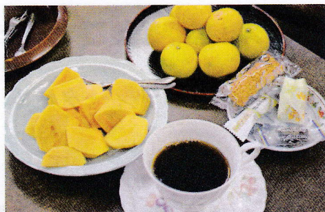
参加者がミカンやカキ を持ってきて、みんなに 振る舞ってくれました